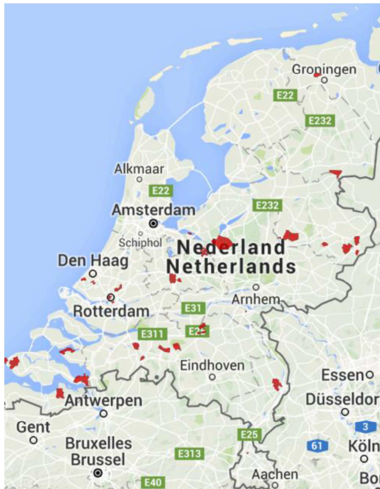
Afbeelding 1: Overzicht uitrolgebieden slimme meter, 4 e kwartaal 2015

In het laatste kwartaal van 2015 is de eerste meting van de consumentenmonitor uitgevoerd. 38 De huishoudens die in het laatste kwartaal van 2015 een slimme meter aangeboden hebben gekregen, vormen daarmee het vertrekpunt van de marktvaagmonitor tijdens de grootschalige uitrol van de slimme meters tot 2020. Onderstaand is te zien in welke gebieden de aanbidding van de slimme meters het 4 e kwartaal van 2015 heeft plaatsgevonden.