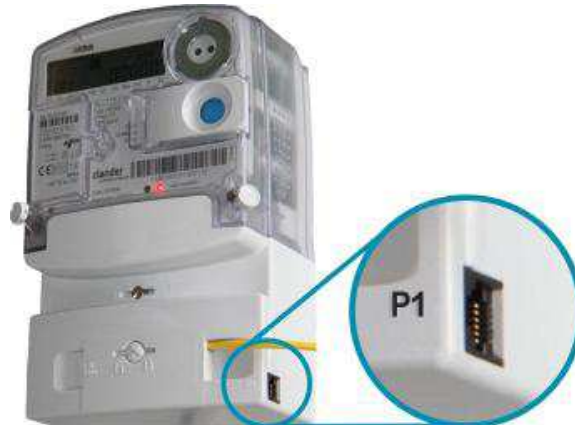
Afbeelding 2: voorbeeld consumentenpoort (P1-aansluiting) voor directe uitleesmogelijkheden

Consumenten die zelf de ontwikkeling van het eigen elektriciteitsverbruik in real time willen volgen, kunnen gebruik maken van de consumentenpoort (P1-poort) op de slimme meter (zie afbeelding 2). Via een op deze poort aangesloten energieverbruiksmanager ontvangt de consument real time informatie over de meterstand, voor elektriciteit is dit elke 10 seconden up-to-date en voor gas elk uur. 20 Daarom wordt feedback via deze consumentenpoort ook wel directe feedback genoemd.